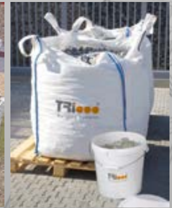
Remplissage pierre/SEEDECO Glass Blocks