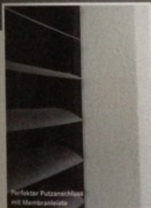
Perfekter Putzanschluss mit Membranleiste

TRiooo Building Systems GmbH Ziegelbreite 6, D-84166 Adlkofen Tel.: +49 (0)8707 93852-0 Fax: +49 (0)8707 93852-29, Email: info@triooo.eu Web: www.triooo.eu